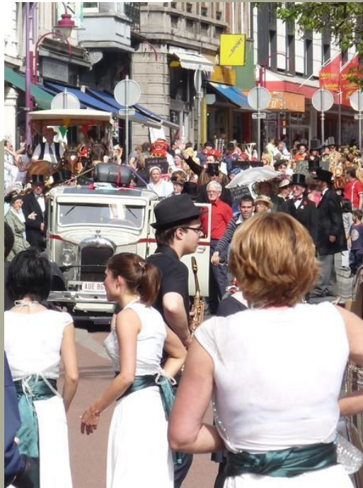
Cortège du Géant Bihin